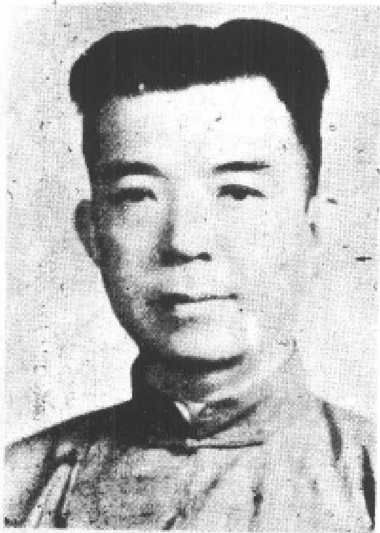
民國三十六年任農林部部長 時攝時年五十五歲