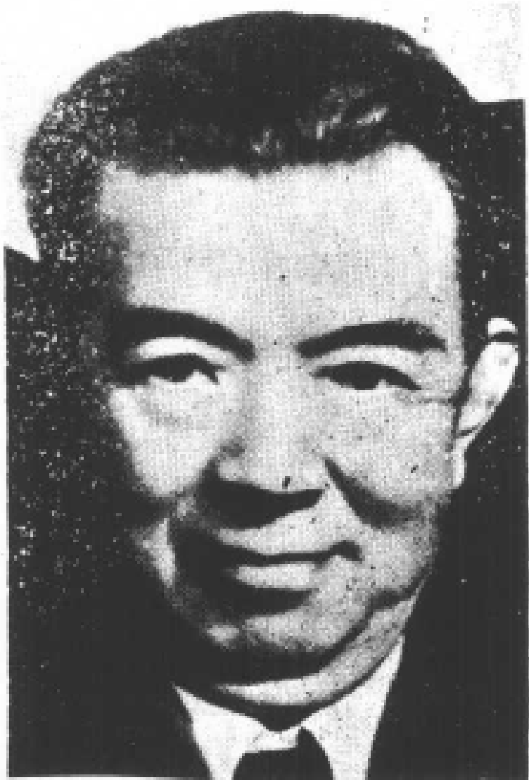
民國四十三年春攝於台北 時年六十二歲