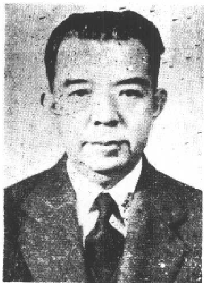
民國四十五年攝於香港 時年六十四歲